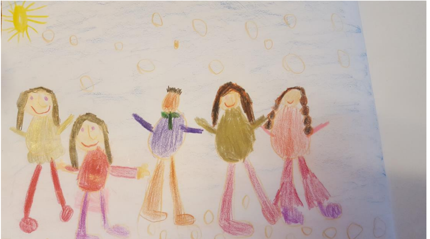
Tekening uit de kleuterklas van juf Daphne